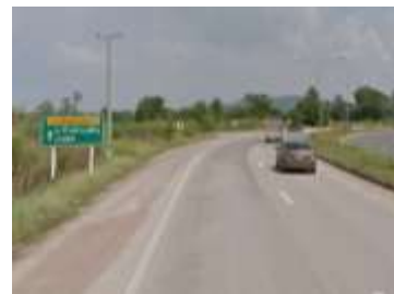
ทางหลวงหมายเลข 225