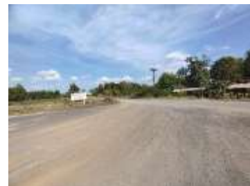
เส้นทางเข้าสู่พื้นที่โครงการ