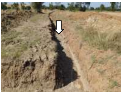
คันทำนบดินและคูระบายน้ำ