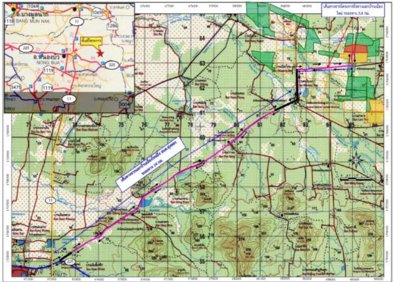
รูปที่ 1-3 แสดงการคมนาคมเข้าสู่พื้นที่โครงการ