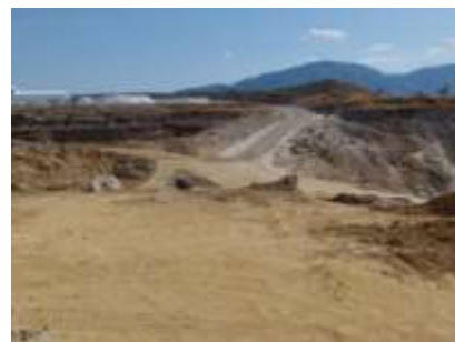
เส้นทางขนส่งแร่ในพื้นที่โครงการ