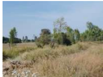
แนวต้นไม้บริเวณพื้นที่ที่ไม่มีการทำเหมือง